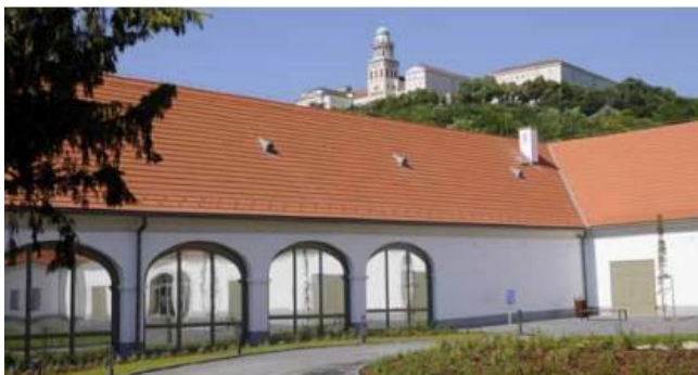
Apátsági Múzeum, Pannonhalma