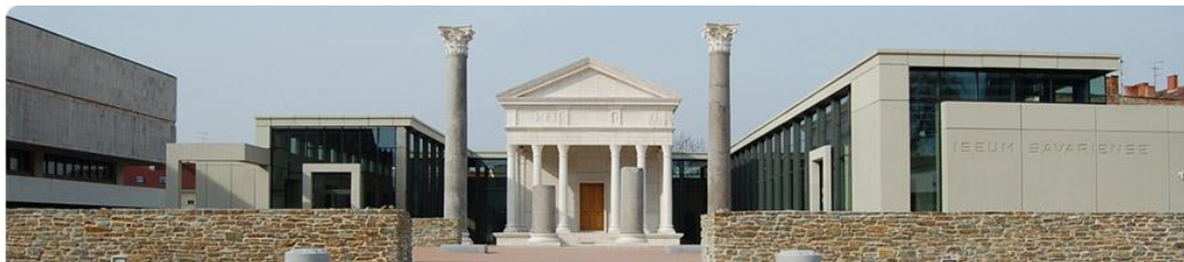
Iseum Savariense, Savaria Múzeum, Szombathely